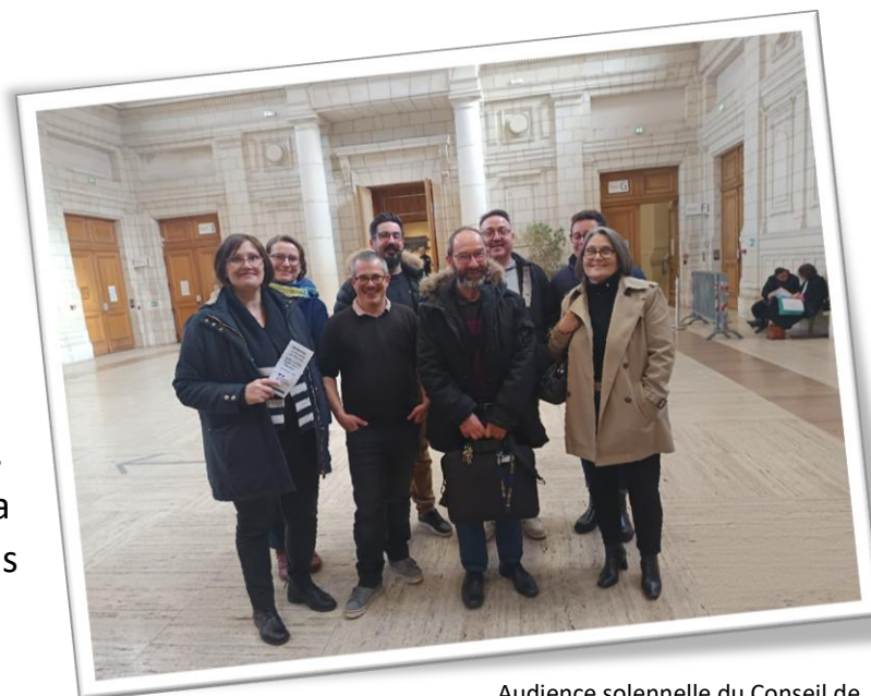
Audience solennelle du Conseil de Prud'hommes d'Angers, vendredi 23 janvier.

La fin des élections professionnelles dans les Très Petites Entreprises (TPE - moins de 11 salarié-es) et la désignation, par le monde agricole, de ses représentant-es dans les chambres d'agriculture marquent le terme du cycle électoral de 4 ans, comptant pour le calcul de la représentativité des organisations syndicales.