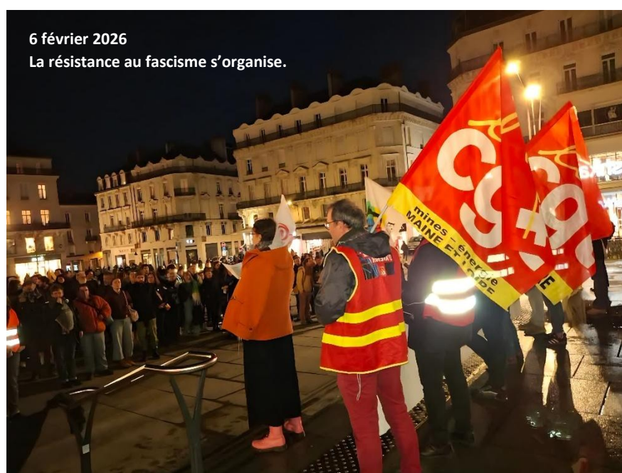
6 février 2026 La résistance au fascisme s'organise.

Ce sont des valeurs que nous faisons vivre dans nos syndicats, dans nos écoles, dans nos entreprises, dans nos luttes quotidiennes.