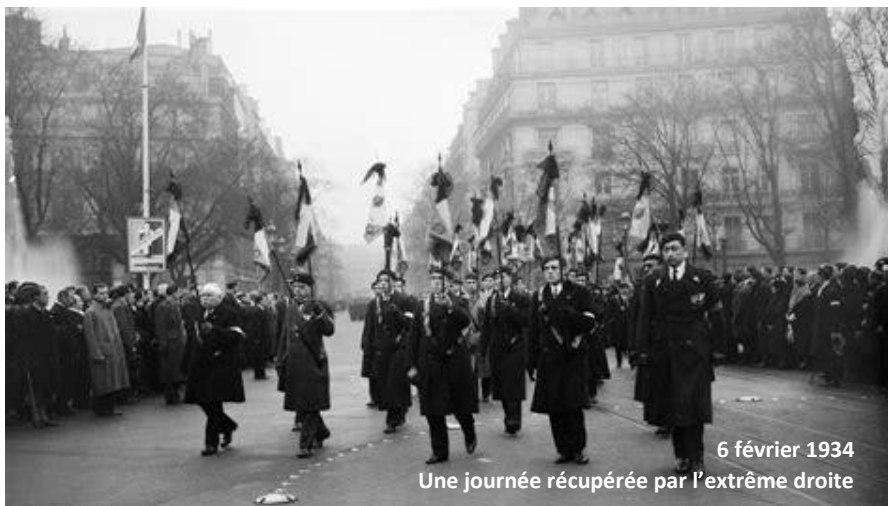
6 février 1934 Une journée récupérée par l'extrême droite

MOI. C'est leur camp que nous revendiquons.